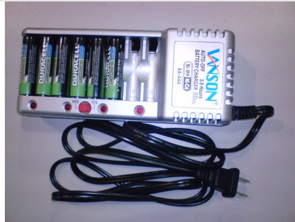
Figura 2-3 Cargador de baterías recargables (AA / AAA)

El Laboratorio cuenta con baterías AA recargables, deben conectarse a la corriente eléctrica (utilizando su cargador adecuado), cuando sea necesario para que el nivel de energía se mantenga en niveles aceptables. Es común esperar a que la batería se encuentre casi descargada para ponerla a recargar, a fin de que no guarde memoria y no logre el nivel máximo en un futuro.