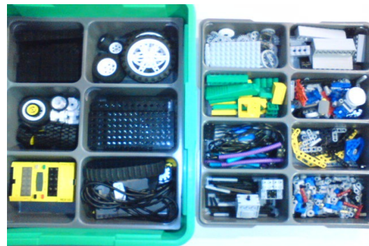
Figura 2-4 Disposición de Piezas del kit LEGO MR Mindstorms 9794