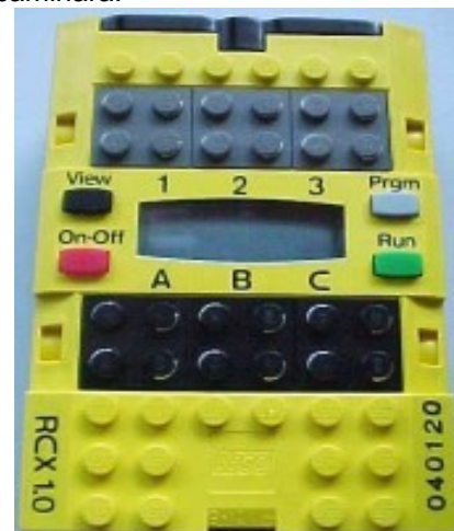
Figura 2-2 Display y botones del LEGO MR Mindstorms 9794