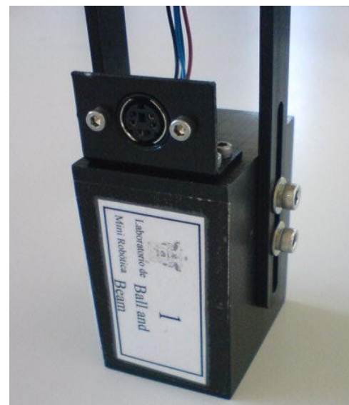
Figura 5-3 Base soporte y conexión del sensor