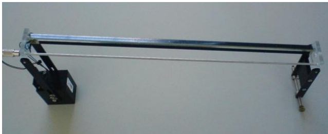
Figura 5-1 Módulo Esfera y Viga (Ball and Beam)